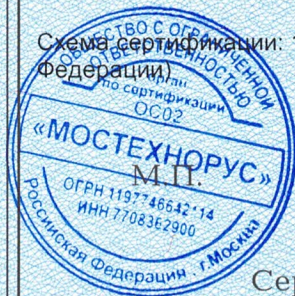
Схема сертификации: 1с (ГОСТ Р 53603-2020 Оценка соответствия. Схемы сертификации продукции в Российской Федерации)